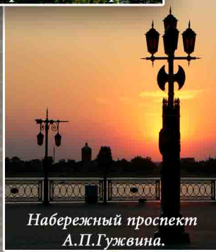
Набережный проспект А.П.Гужвина.